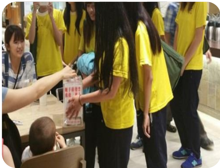
辦理學生志工服務-發票募集

105年10月24日春暉社共36位學生，和創世基金會共同至新光三越募集發票，培養師生關懷社會的人文情操。