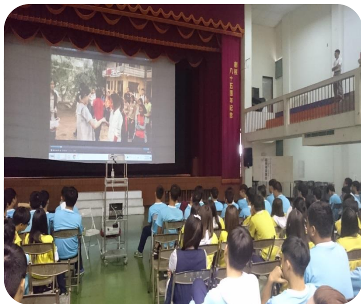
辦理學生志願服務學習講座