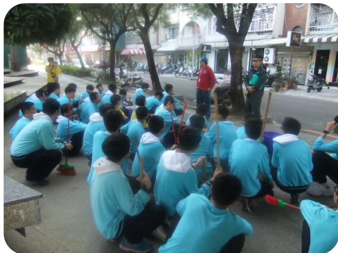
辦理學生志工服務-社區打掃

105年12月13日及12月20日辦理社區友善校園打掃，鼓勵學生參與校內外服務，參與學生達700人次，培養學生愛護鄰里關懷社會的人文情操，建立服務樂群的觀念。