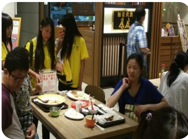
辦理學生志工服務-發票募集