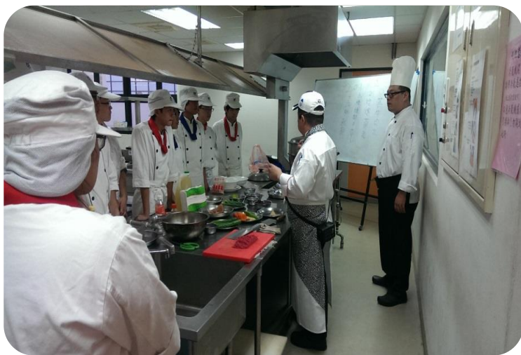
辦理學生乙級證照班

於105年11月29日～106年2月21日辦理中餐烹調乙級訓練班(每週二、日17:30-21:30)。