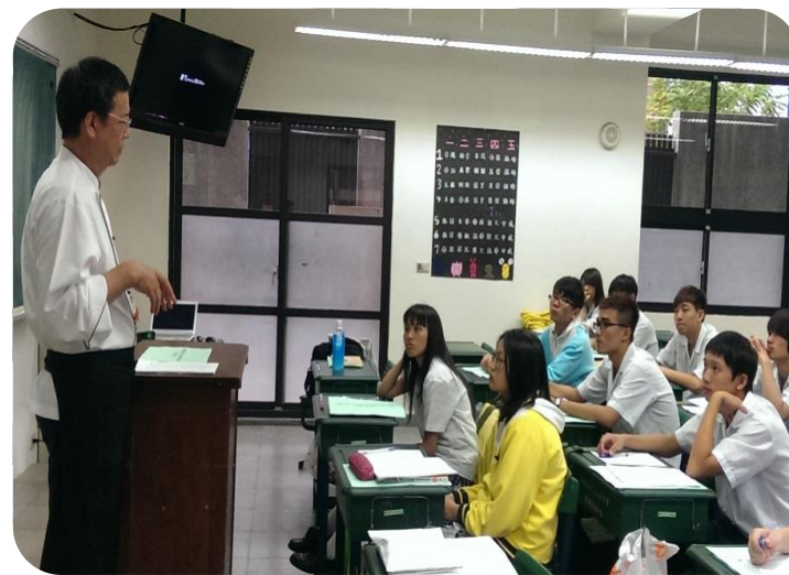
辦理學生乙級證照班