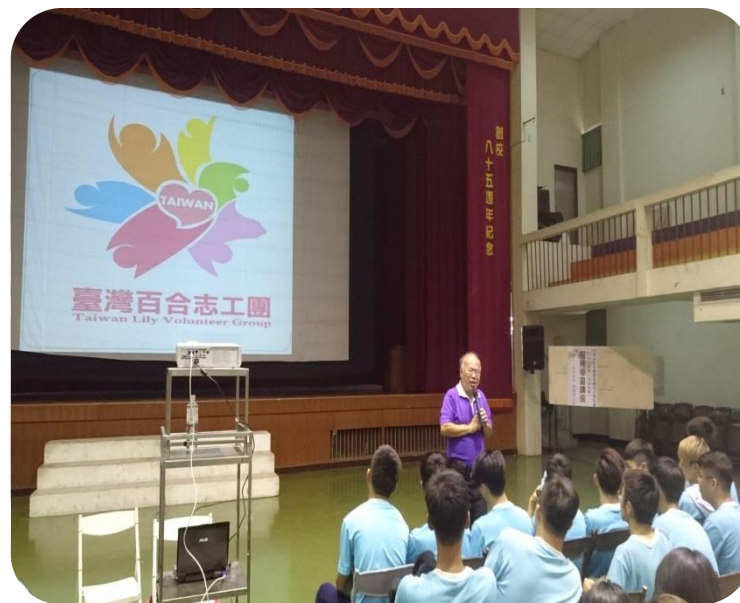
辦理學生志願服務學習講座