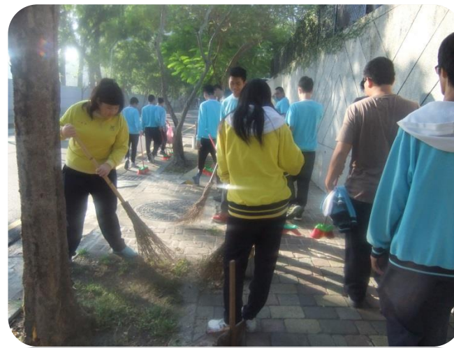
辦理學生志供服務-社區打掃